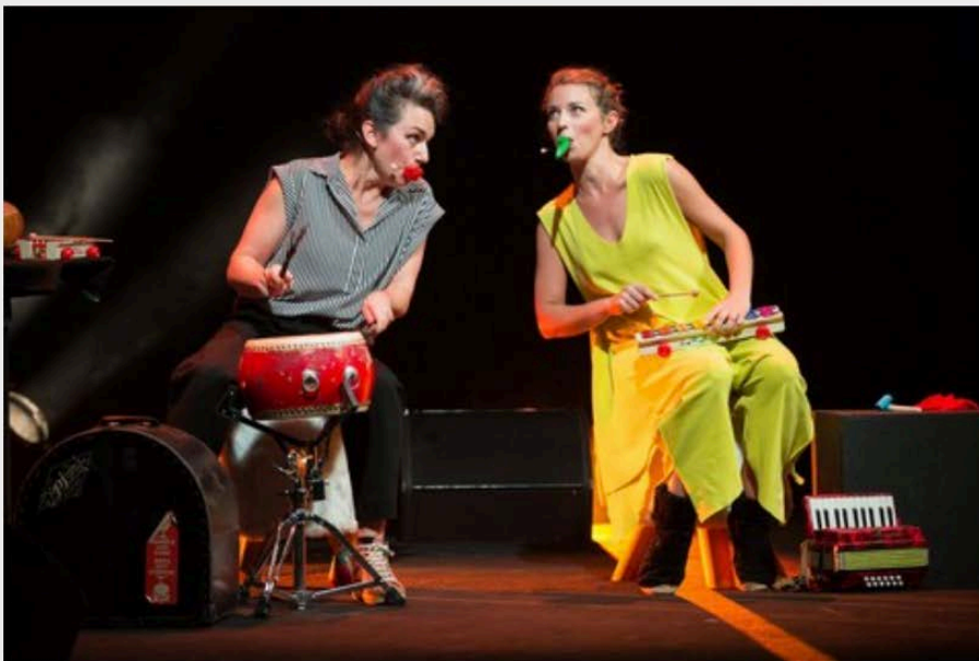
Söta Sälta

Tous les 15 jours, le Mercredi, la chronique JEUNE PUBLIC animée par Nicolas Céléguène